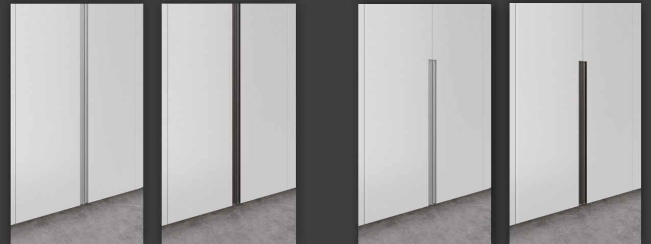
ALUMINIO ANODIZADO NATURAL ANODIZED ALUMINUM NATURAL