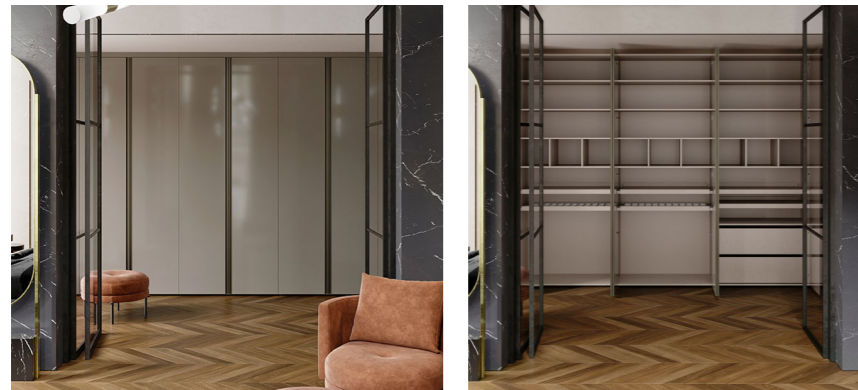
PUERTAS BATIENTES MODELOS CITY LAQUEADO Terminación: Laqueado Brillante Arcilla / Manija: Perfil aluminio Titanio