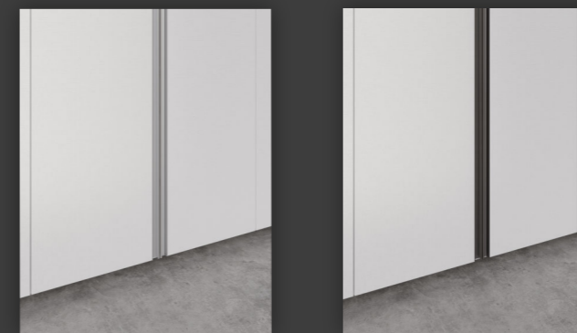
ALUMINIO ANODIZADO NATURAL ANODIZED ALUMINUM NATURAL