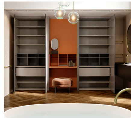
INTERIORES DEL PLACARD Melamina Seda Giorno Equipado con estantes botineros y cajones con perfil manija en aluminio Titanio. Ordenadores de 12 mm de espesor, terminación laqueado mate Terra.