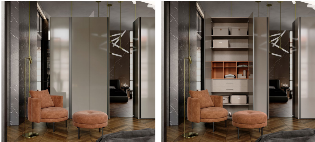
PUERTAS BATIENTES MODELOS CITY LAQUEADO Terminación: Laqueado Brillante Arcilla / Manija: Perfil aluminio Titanio